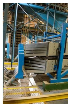
CONJUNTO DE ESPIRAL (ESQ.) E CONJUNTO DE PADRONIZADORES POR PENEIRAS (DIR.) PARA CLASSIFICAÇÃO DE GRÃOS – UNIDADE DE BENEFICIAMENTO DE SEMENTES