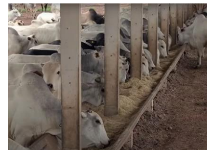
BOVINOS COMENDO A RAÇÃO OFERTADA EM COCHO – FASE ENGORDA/SEMICONFINAMENTO

▪ Confinamento: é constituído por 34 boxes destinados a engorda, com capacidade estática de cerca de 5.000 animais. As atividades se concentram no período de abril a novembro, tendo as condições climáticas de chuvas como limitação da atividade.