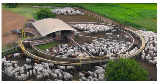
CURRAL DE TRIAGEM DOS NOVILHOS

Nessa etapa do processo produtivo, são ofertados de 02 a 04 kg de ração por dia confeccionada pela própria Recorrente, permitindo a alta taxa de lotação das pastagens, chegando a 15 unidades animal por hectare, onde há o pastejo para oferta de volumoso e a oferta do concentrado energético / proteico em estrutura de cochos cobertos. Observe-se as ilustrações abaixo: