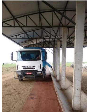
CAMINHÃO REALIZANDO A DISTRIBUIÇÃO DA RAÇÃO NOS COCHOS – FASE ENGORDA/SEMICONFINAMENTO