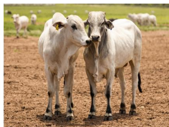
BRINCAGEM PARA INCLUSÃO NO SISTEMA SISBOV E MONITORAMENTO DAS ETAPAS DE RECRIA E ENGORDA