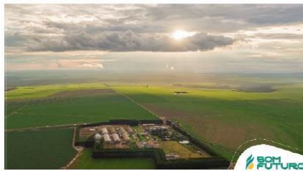
Figura 1 – Foto Fazenda Fartura

[...] a Recorrente desenvolve, há mais de 40 anos, atividade econômica nas áreas da agricultura, pecuária, sementes e piscicultura, conforme se constata do seu contrato social. Eis uma fotografia de uma de suas unidades produtivas (extraída da página 13 do Parecer Técnico):