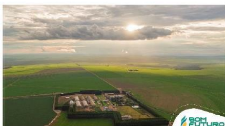
Figura 1 – Foto Fazenda Fartura

[...] a Recorrente desenvolve, há mais de 40 anos, atividade econômica nas áreas da agricultura, pecuária, sementes e piscicultura, conforme se constata do seu contrato social. Eis uma fotografia de uma de suas unidades produtivas (extraída da página 13 do Parecer Técnico):