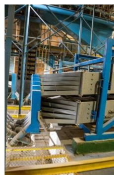
CONJUNTO DE ESPIRAL (ESQ.) E CONJUNTO DE PADRONIZADORES POR PENEIRAS (DIR.) PARA CLASSIFICAÇÃO DE GRÃOS – UNIDADE DE BENEFICIAMENTO DE SEMENTES