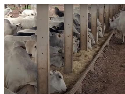
BOVINOS COMENDO A RAÇÃO OFERTADA EM COCHO – FASE ENGORDA/SEMICONFINAMENTO

▪ Confinamento: é constituído por 34 boxes destinados a engorda, com capacidade estática de cerca de 5.000 animais. As atividades se concentram no período de abril a novembro, tendo as condições climáticas de chuvas como limitação da atividade.