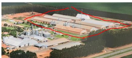
UNIDADE DE BENEFICIAMENTO DE SEMENTES (FAZENDA FARTURA - CAMPO VERDE/MT)

Nesse cenário, a Recorrente adquire sementes com melhoramento genético (cultivares), destinando-as como matéria-prima para uma das unidades de beneficiamentos, processamento e armazenamento.