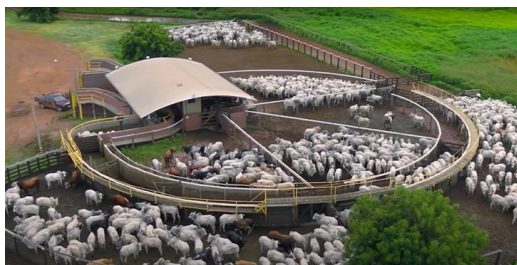
CURRAL DE TRIAGEM DOS NOVILHOS

Nessa etapa do processo produtivo, são ofertados de 02 a 04 kg de ração por dia confeccionada pela própria Recorrente, permitindo a alta taxa de lotação das pastagens, chegando a 15 unidades animal por hectare, onde há o pastejo para oferta de volumoso e a oferta do concentrado energético / proteico em estrutura de cochos cobertos. Observe-se as ilustrações abaixo: