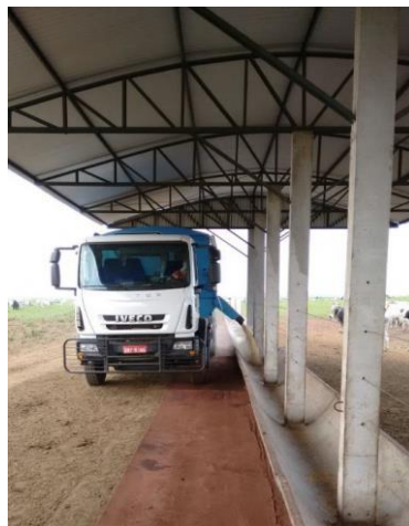
CAMINHÃO REALIZANDO A DISTRIBUIÇÃO DA RAÇÃO NOS COCHOS – FASE ENGORDA/SEMICONFINAMENTO