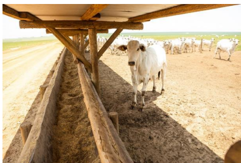
FASE DE RECRIA – NOVILHO EM ESTRUTURA SEMI-INTENSIVA, COM O FORNECIMENTO DE RAÇÃO CONFECCIONADA PELA BOM FUTURO EM ESTRUTURA DE COCHOS COBERTOS