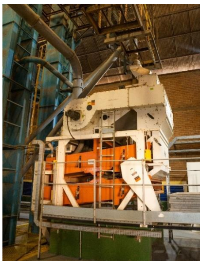
MÁQUINA DE PRÉ-LIMPEZA UNIDADE DE BENEFICIAMENTO DE SEMENTES

Na etapa seguinte, realiza-se a limpeza dos grãos, onde são retiradas as impureza e fragmentos de grãos que serão descartados do processo de produção de sementes. A limpeza dos grãos também é realizada de forma segregada por cada cultivar, sendo que as máquinas de secagem são previamente preparadas e configuradas para receber um tipo específico por vez.