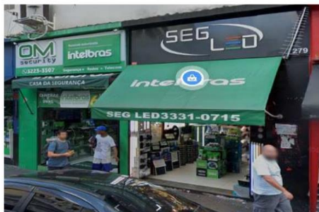
R. Santa Ifigênia, 279 (google maps)