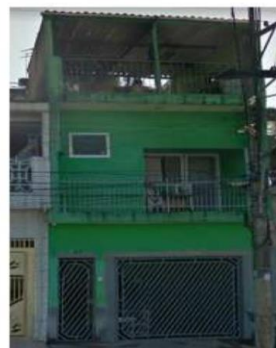
R. Magnólia Azul, 183, São Paulo - SP