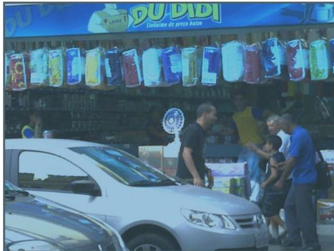
Foto 10 - Empresa Mineiro e Mota Ltda, localizada na Rua Batista de Oliveira, 345, Centro, JF. Observa-se o letreiro "LOJAS DU DIDI".

52. Ademais se deve registrar que enquanto funcionava, a pessoa jurídica impugnante, ostentava o logotipo das “LOJAS DU DIDI”, cf. cópia de foto abaixo, retirada da fl. 1.439 dos autos.