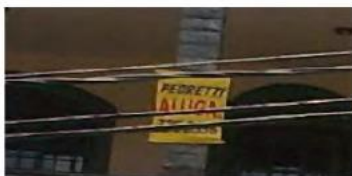
Placa de aluguel no endereço presumido da autuada