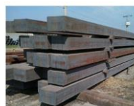
Produto Bloco dos lingotamento contínuos, sobre peso de madeira serrada. Peso do bloco 4.720 kg

Esses produtos não são movimentados pela força humana, mas sim por pontes rolantes e guinchos, presos por cintas, cabos de aço, ganchos, etc. Sem cintas e estropos de cabos de aço, por exemplo, seria impossível suspender os materiais. Sem as madeiras, por outro lado, não seria possível acessar os materiais por baixo, permitindo passagem de cabos de aço, cintas e o uso de empilhadeiras.