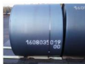
Produto Bobina de chapão, pronta para embalar, amarrada com fita de aço e o selo de fixação. Peso da bobina 4.596 kg

Tratam-se, especificamente, de madeira serrada, dormente de madeira, estropos de cabo de aço, lingas correntes, trilhos, grampos de fixação e cintas de nylon, insumos imprescindíveis à movimentação interna de produtos de grande porte e elevado peso, empregados ao longo das diversas etapas do processo produtivo, sem os quais a própria conclusão da produção restaria inviabilizada. Vejamos: