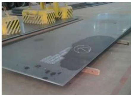
Produto chapa de aço, sobre madeira de serrada. Peso da chapa 2.180 Kg

As fotos abaixo ilustram alguns desses itens: