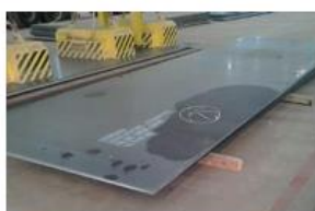
Produto chapa de aço, sobre madeira de serrada. Peso da chapa 2.180 Kg

As fotos abaixo ilustram alguns desses itens: