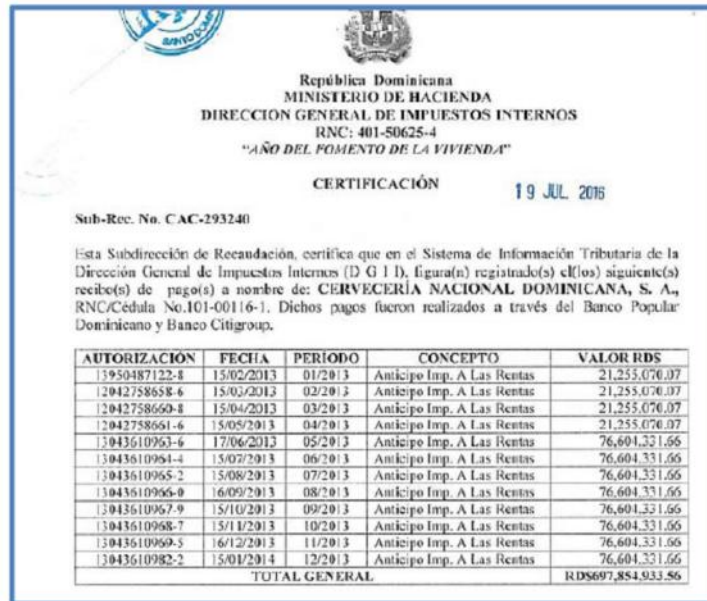
Figura 2 - Exemplo do Comprovante de Pagamento Bancário