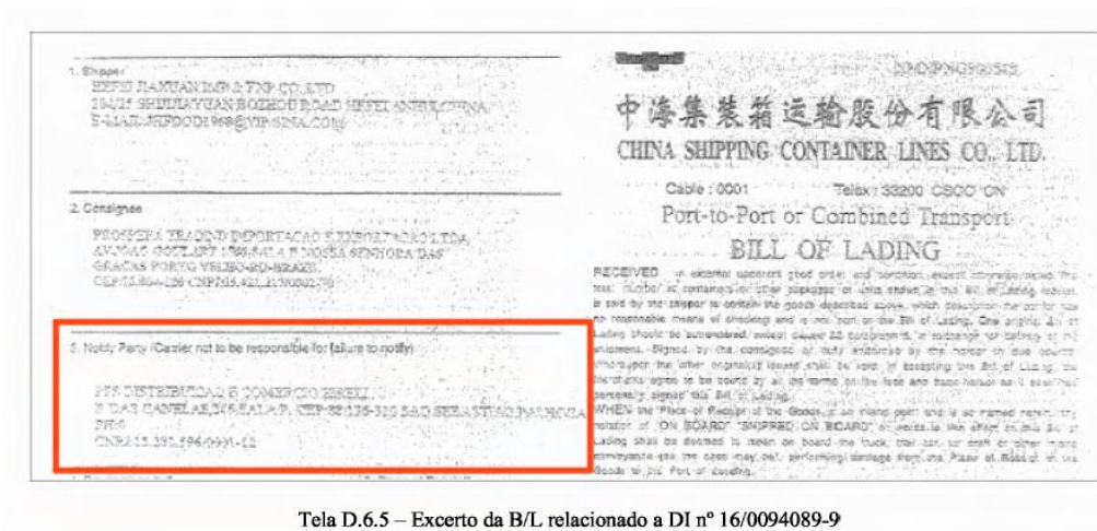
Tela D.6.5 – Excerto da B/L relacionado a DI n° 16/0094089-9

Ainda seguindo com a fiscalização, foram observados que alguns documentos vinculavam o nome das empresas PROSPERA e PPS, vejamos (e-fl. 121)