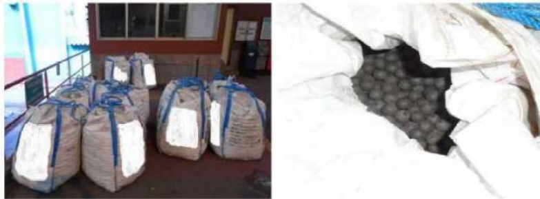
Figura 29d: Exemplo de recebimento de insumos e bolas de moinho

Na moagem de minérios há a mistura de fundentes, como o Antracito, junto com as bolas de moinho que auxiliam cada operação realizada. Há diferentes silos que alimentam o processo contínuo da produção de pelotas. Esses silos também são alimentados regularmente por veículos automotivos, que combinam pás carregadeiras para alimentação dos chutes de carvão, caminhões com carroceria reforçada para transporte da Bentonita e também de caminhões basculantes para transporte das bolas de moinho. O uso de veículos automotivos é parte do processo produtivo porque os fornecedores das bolas de moinhos e outros insumos descarregam o material fornecido em local próprio, denominado Pátio de Insumo e posteriormente são encaminhados diretamente da linha de produção. Esse processo se faz necessário para assegurar segurança interna do trabalho e regularidade de fluxo, uma vez que os operadores desses veículos estão qualificados para esses procedimentos operacionais. Em função das características operacionais dos insumos e arranjo físico das usinas do Complexo de Tubarão, a ausência desses veículos provoca ruptura no processo produtivo. Os componentes desses veículos, como pneus e outros acessórios sofrem desgaste pela exposição contínua às intempéries físicas do processo produtivo. A figura 29d ilustra como são recebidos os insumos fundentes e as bolas de moinho, em bags de pelo elevado para movimentação sem equipamento próprio.