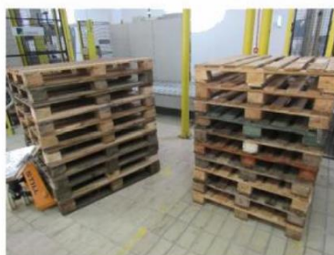
Figura 18 – Pallets de madeira utilizados em áreas não produtivas

Na Figura 18 são mostrados pallets de madeira utilizados na fábrica, em áreas onde não existe contato com o processo produtivo.