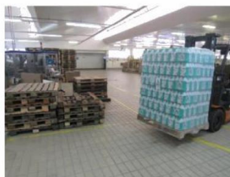
Figura 10 – Leite UHT embalado pronto para o armazenamento

A Figura 10 mostra um pallet de leite UHT embalado em garrafa PET, paletizado e envolvido pelo stretch hood, sendo transportado pela empilhadeira até o depósito de armazenagem.