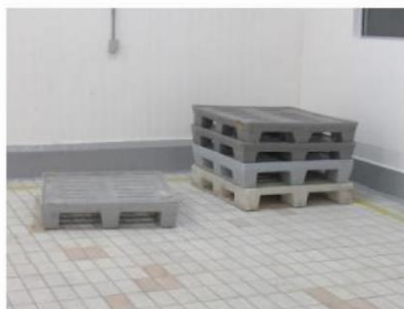
Figura 19 – Pallets plásticos utilizados em áreas produtivas

Atentando que dentro das áreas de onde existe contato direto com o produto, o pallet obrigatoriamente é fabricado em plástico para não ocorrer contaminação do produto. Na Figura 19 são mostrados pallets plásticos utilizados nas áreas produtivas.