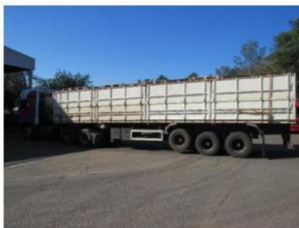
Figura 20 – Transporte de pallets na fábrica de Teutônia (RS)

A Figura 20 mostra uma carga de pallets de madeira entrando na fábrica de Teutônia (RS).