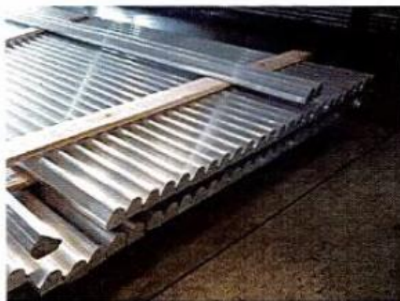
Foto 3.a - Perfis comprados pelo cliente.

Em seguida passa por um processo de corte, conforme apresentado nas fotos abaixo: