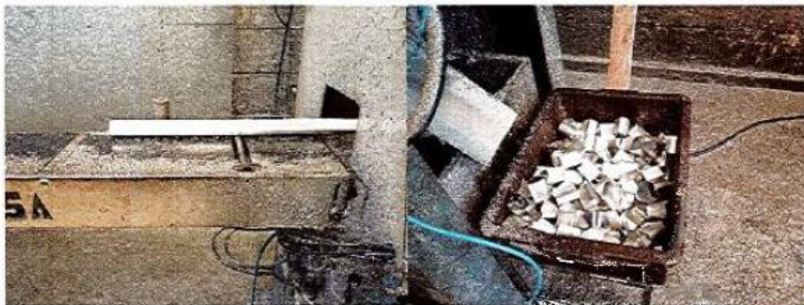
Foto 3.b - Perfis cortados em peças menores.

Em seguida passa por um processo de corte, conforme apresentado nas fotos abaixo: