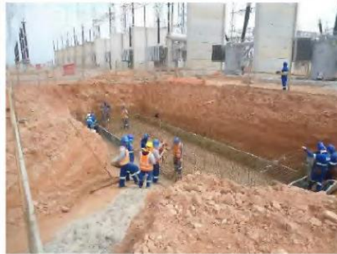
Figura 148 – Serviços de construção civil na subestação.

- serviço de mão-de-obra: (i) montagem no tanque tanque (item 9.8.7, Laudo Técnico); (ii) montagem de componentes diversos, que serão utilizados para conexão do transformador à rede (item 9.8.8); (iii) montagem do núcleo toroidal, que consiste em fazer a fase de bobinagem secundária do transformador de corrente (item 10.2.1).