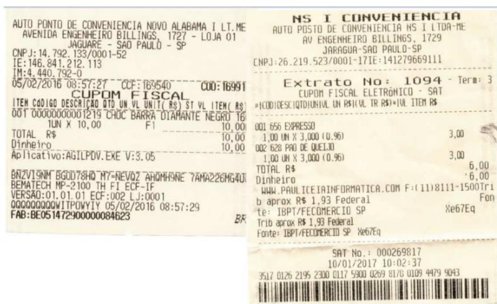
Figura 8 - Foto dos cupons fiscais emitidos pela NOVO ALABAMA I e NS I indicando endereço muito próximo.