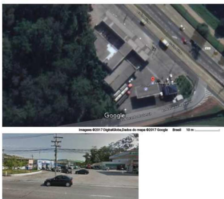
Auto Posto Universitários