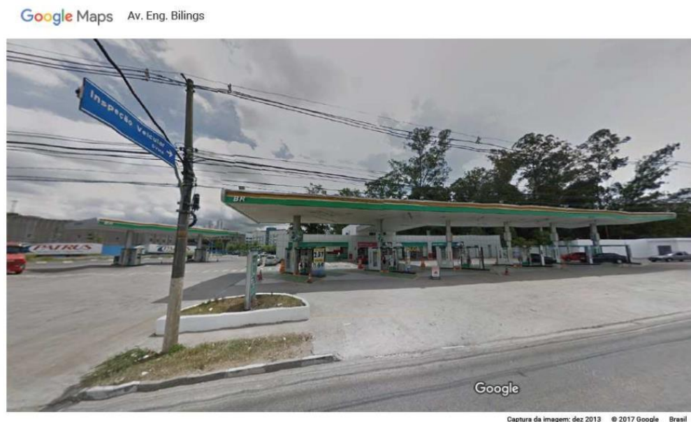
Figura 5 - Fotos do estabelecimento MÚLTIPLO usado simultaneamente por 6 empresas ligadas ao GRUPO.

Tabela 4 - Endereços e período de atividade das empresas apontando coincidências e um único estabelecimento de auto usado por diversas empresas do GRUPO.