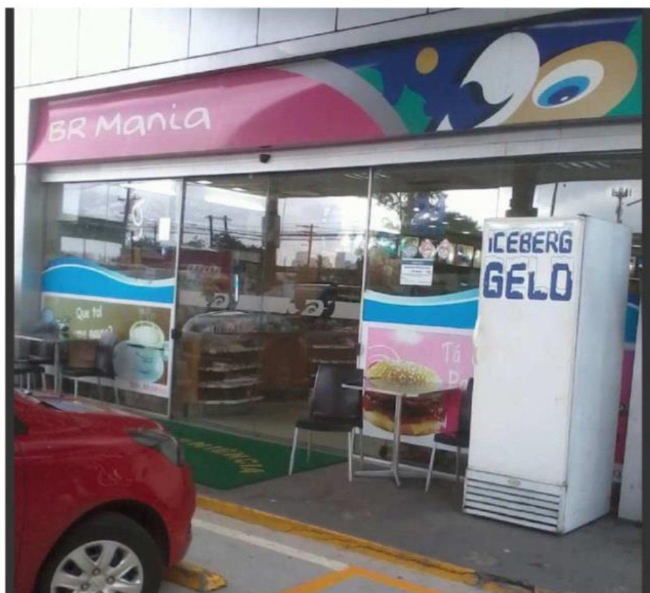
Figura 7 - Foto e localização do estabelecimento MÚLTIPLO usado simultaneamente por 6 empresas ligadas ao GRUPO - loja de conveniência associada ao posto de combustível.