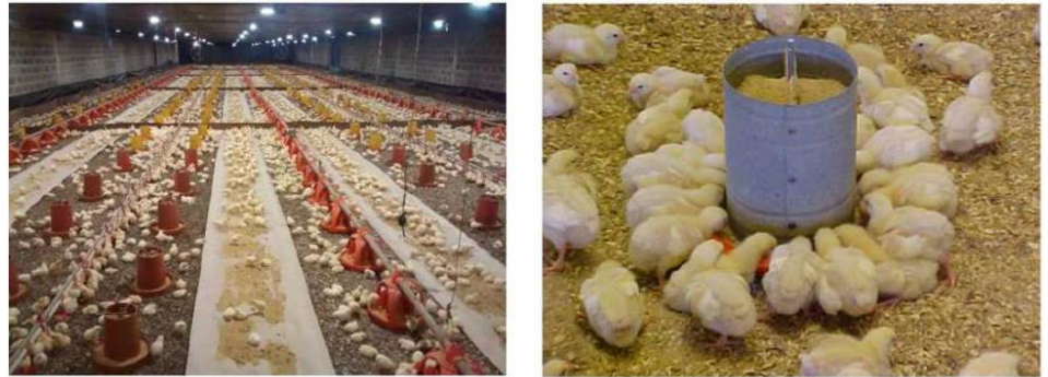
Figura 33 - Aves bem distribuídos com ração a vontade

A ração permanece sempre disponível, desde a chegada das aves até o momento do jejum pré-abate (Figura 33). É mantida limpa e isenta de fezes ou cama, para que todas as aves possam alimentar-se normalmente sem disputas e sem desperdício.