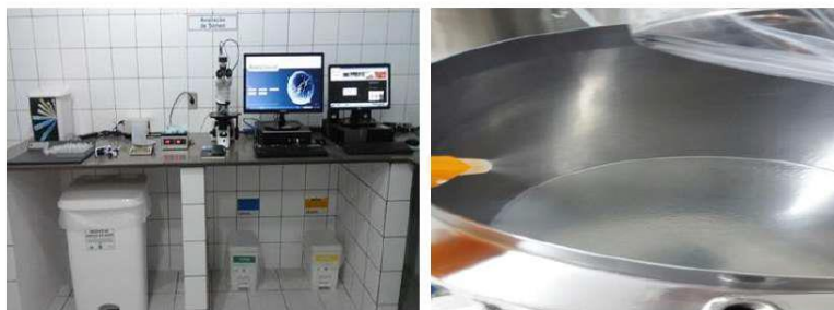
Figura 13 – Bancadas Limpas

Limpar as bancadas do laboratório diariamente utilizando papel toalha descartável (Padrão na Figura 13), antes do início das atividades embebido em álcool 70%, e após as atividades embebidas em hipoclorito de sódio a 1%.