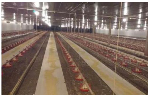
Figura 7 - Padrão para Papel de Pinteira

Utilizar a ração sobre faixas de papel distribuídas ao lado de cada linha de Nipple na pinteira para estimular o consumo inicial. O papel deverá ser mantido limpo e renovado até o 3º dia de vida das aves, conforme Figura 7 abaixo.