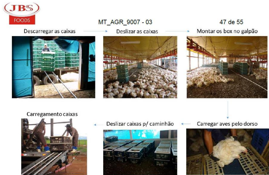
Figura 39 - Fluxo Padrão de Carregamento

Conforme se percebe, tanto a Manifestação de Inconformidade quanto o Recurso Voluntário apresentados pela recorrente defendem o direito a creditamento das Contribuições sobre os serviços de munck, guindaste e retroescavadeira em função do fato de que eles estariam associados com o carregamento de aves.